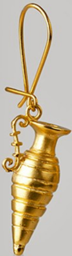
No 5 Silver 925 Βάρη σε gr 13gr