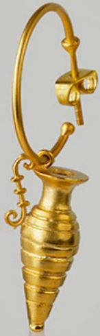
No 5 Silver 925' σε gr 13gr